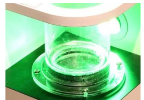
「アクア・ウェーブ」

目には見えない「音」を可視化するこれらの新展示を通して、子どもを中心とした一般の人々が全身を使って科学や技術への興味を高め、また学ぶ機会を提供していきます。