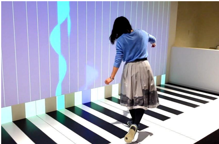
「ジャンボ・ピアノ」

音によって変化する水面の様子を観察する「アクア・ウェーブ」や、同じく音によって変化するレーザーの光跡を観察する「レーザー・ダンス」、鍵盤をふむと音が出るとともにそれに応じた色やかたち、大きさの波があらわれる「ジャンボ・ピアノ」など、体感型の展示物で構成した特別な空間です。