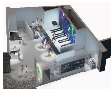
「サウンド」展示室パース図

※新展示室「サウンド」は、“「遊び」「創造」「発見」の森”をコンセプトとしたFOREST（フォレスト）展示室群の一室です。さまざまな体験を通じて、何かを感じ取ることができる仕掛けがいっぱいのエリアです。