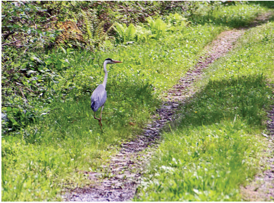
山路を歩くあとを距離を縮めながらついていく

山路でアオサギに出会い、そっと近づいて 30 分ばかり写真を撮らせていただきました。幼鳥でしょうか、静かに驚かせないように、話しかけながら近づいたら、飛び立って逃げることもなく、路から川岸へと私の前 4～5メートルの距離で、こちらを見ながらゆっくりと移動いたしました。14時1分～14時32分の間 96 枚の写真を撮らせてもらいました。水鳥は警戒心が強いのに、まったく予想しない事態で嬉しいことでした。