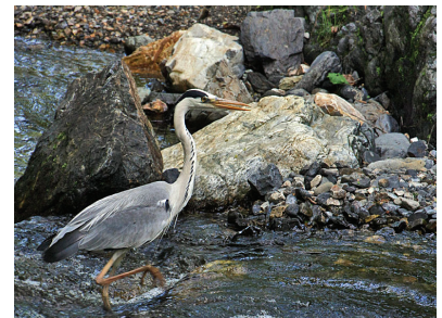
“これまで”と言ったのか、飛び立って、少し離れた場所に隠れました