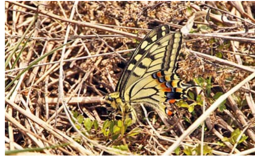
4/14 産卵中のキアゲハ