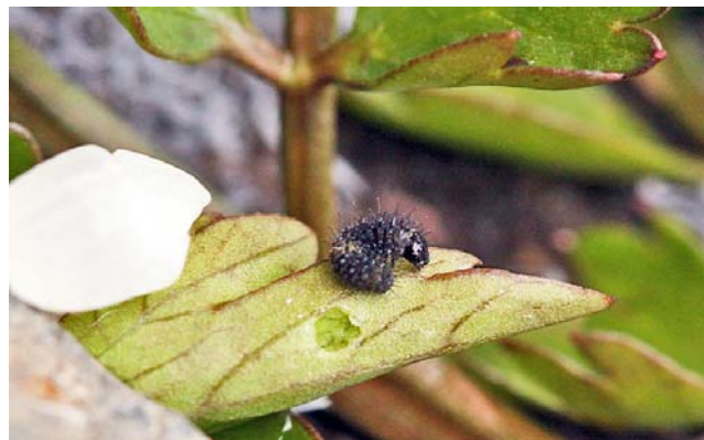
1時間23分で食べ終わる。葉には卵の付いていた跡が残る