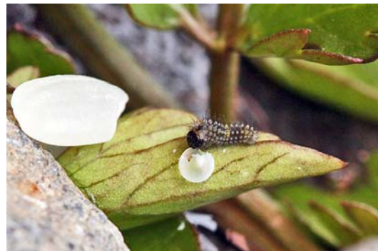
左の米粒と大きさ比較、 幼虫はすぐに回転して卵の殻を食べ始める