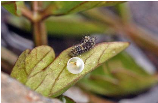
4/23 孵化したばかりの幼虫