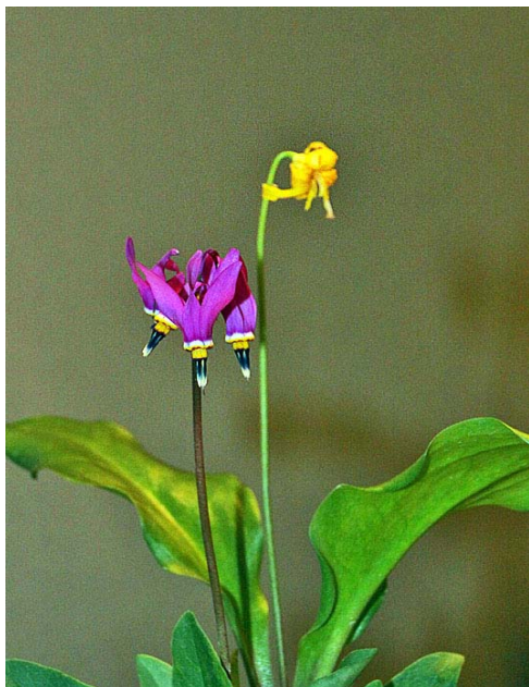
ドデカテオン（左）とキバナカタクリ（右）

家に帰って山野草の花棚をみたら、イカリソウ、ムラサキケマン、マムシグサの花が咲いていました。山野草は季節になると、ひっそりと咲き始めるので、可愛がって大事にしたいと思います。