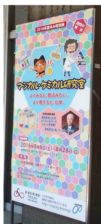
建物玄関前に看板を設置

「モル」や「化学平衡」など、一見とっつきにくい化学の重要な概念について、実は日常で類似の概念を扱っていることなど、興味がわくような表現や物語などで紹介する解説パネルで構成した。