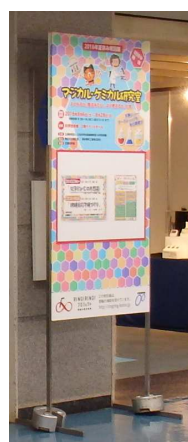
会場入口前に看板を設置