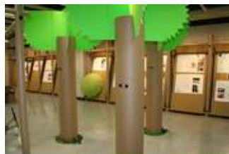
段ボールによる会場づくり